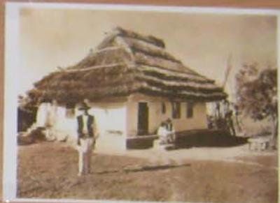
Casele din Buzău