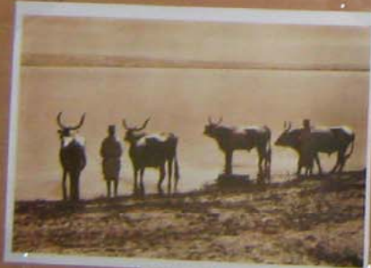
Casele din Buzău