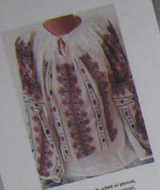
Când ai venit, când ai plecat, Nu poți avea nici un secret, Căci Români e un sat, Și tacerea e deosebit.