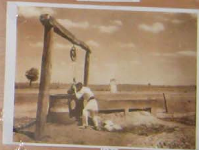
Casele din Buzău