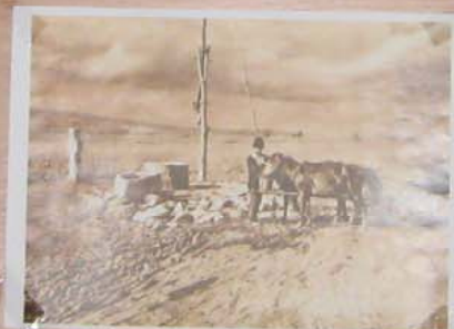
Casele din Buzău