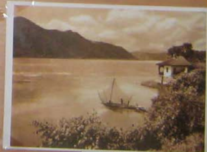
Casele din Buzău