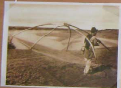
Casele din Buzău