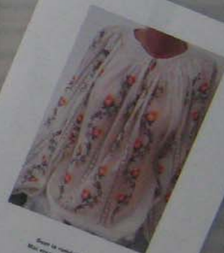
Este la comanda, Mă așteaptă să mă întorc Și să mă văd cu ea, Pe unde și să mă văd.