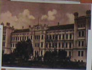
Building of ...