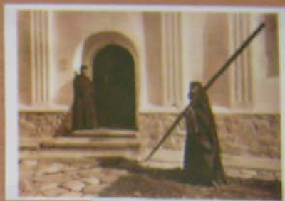
Școala din Buzău