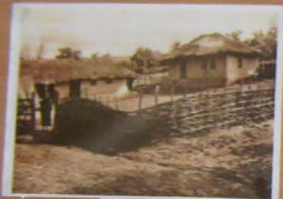
Casele din Buzău