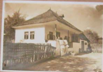
Casele din Buzău