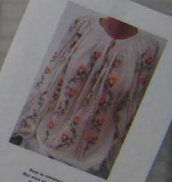
Este la românească, Mă aștept să mă întâlnesc Cu părinții mei, Pe unde și eu călătoresc.