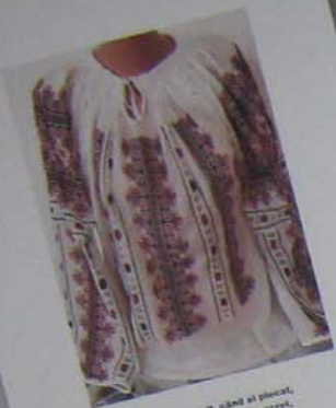
Când ai venit, când ai plecat, Nu poți avea nici un secret, Căci Rumâni e un sat, Și tacutul e deosebit.