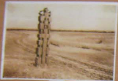
Clădirea din Buzău